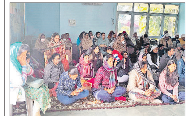
करनाल। कृष्ण चौदस पर श्री घंटाकर्ण महावीर तीर्थस्थान में भक्ति संगम के दौरान भजन प्रस्तुत करते श्रद्धालु।