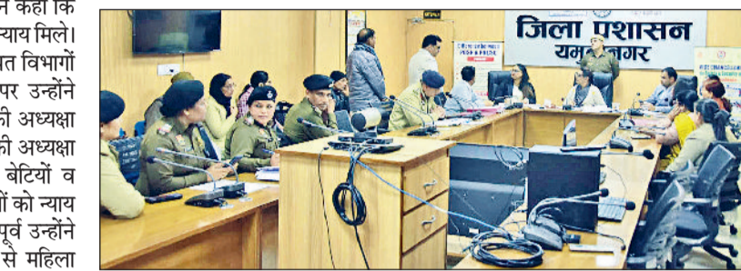
यमुनानगर। जिला सचिवालय में बैठक की अध्यक्षता करती महिला आयोग की अध्यक्ष रेणु भाटिया।

शुद्धि से पूर्व लड़का-लड़की की करवाई जाएगी काउंसलिंग जिले के उच्च अधिकारी व महिला काउंसलर होंगी शामिल