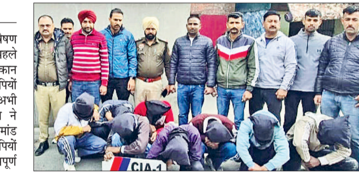
यमुनानगर के साढ़ौरा में दुकान से हुई लूट मामले में गिरफ्तार किए गए आठ आरोपी पुलिस हिरासत में बंदे हुए।