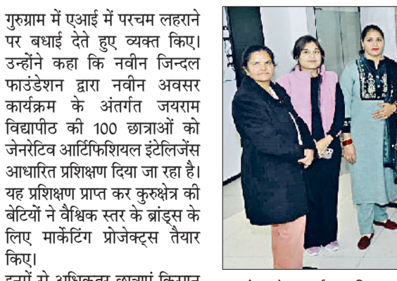
कुरुक्षेत्र। जेन एआई का प्रशिक्षण लेने वाली जयराम विद्यापीठ कुरुक्षेत्र की छात्राएं।

के अत्याधुनिक कौशल, डिजिटल समझ और कार्यस्थल के लिए आवश्यक दक्षताओं से लैस करना रहा ताकि वे बदलते कार्यक्षेत्र में आत्मनिर्भर होकर आगे बढ़ सकें। उन्होंने बताया कि इस कार्यक्रम का शुभारंभ 17 नवंबर 2025 को सांसद