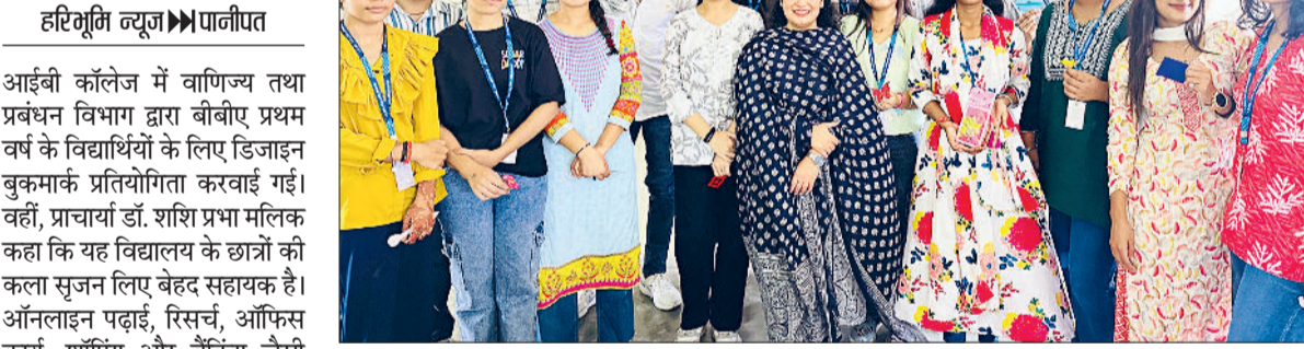
पानीपत। आईबी कॉलेज के विजेता विद्यार्थी प्रसन्न मुद्रा में।

■ विद्यार्थियों के लिए डिजाइन बुकमार्क प्रतियोगिता आयोजित